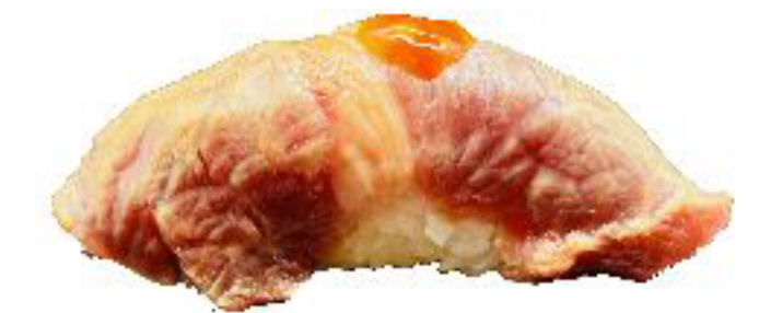
15/ NIGIRI BEEF manzo scottato con yakiniku