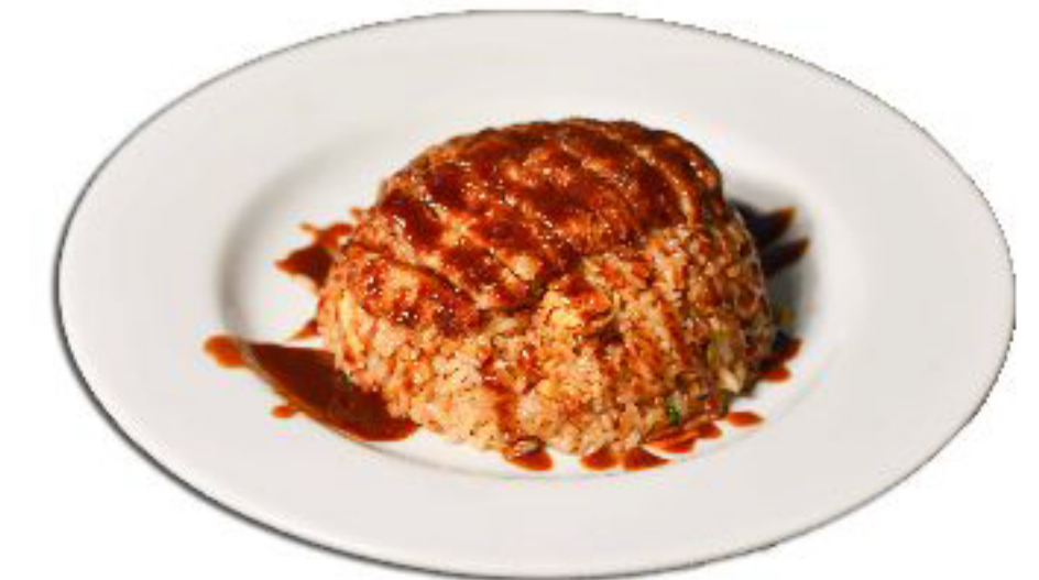
4/KATSUDON riso con verdure misti e cotoletta di maiale