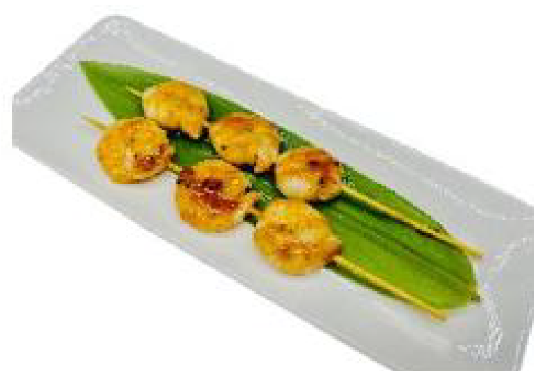
1/EBI YAKI spiedini di gamber