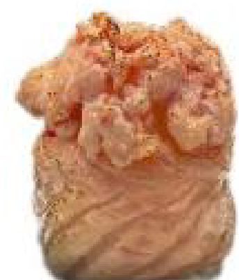
6/ GUNKAN FLAMBE salmone scottato, riso, teriyaki