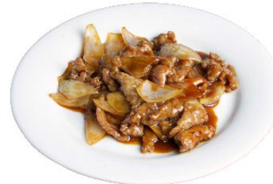
7/MANZO IN BLACK PEPE manzo saltato con cipolla e pepe nero