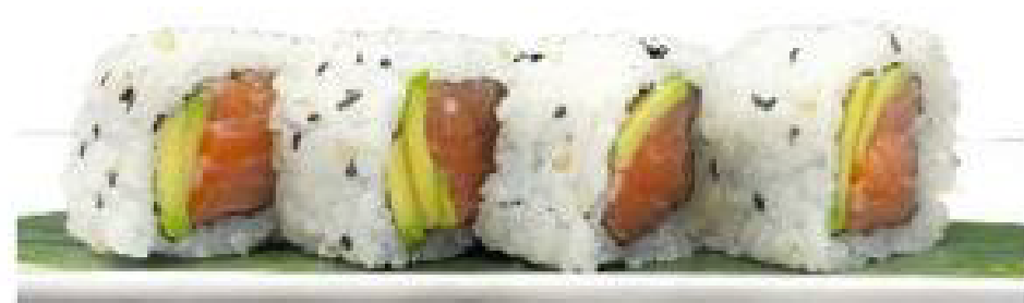
1/ SAKE AVOCADO roll di riso farciti con alga nori, salmone crudo, avocado, rìto bik rosso