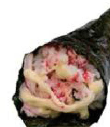
4/ TEMAKI CALIFORNIA cetrioli, avocado e polpa di granchio