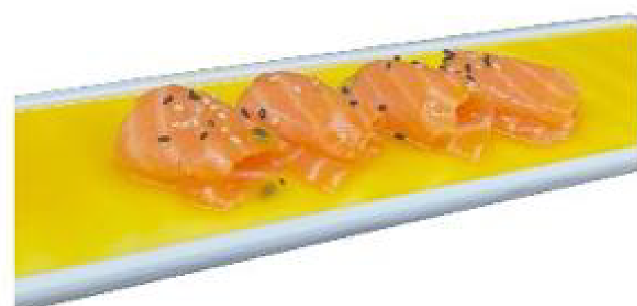
9/ SAKE ESOTICO salmone crudo, semi sesamo e salsa passion fruit