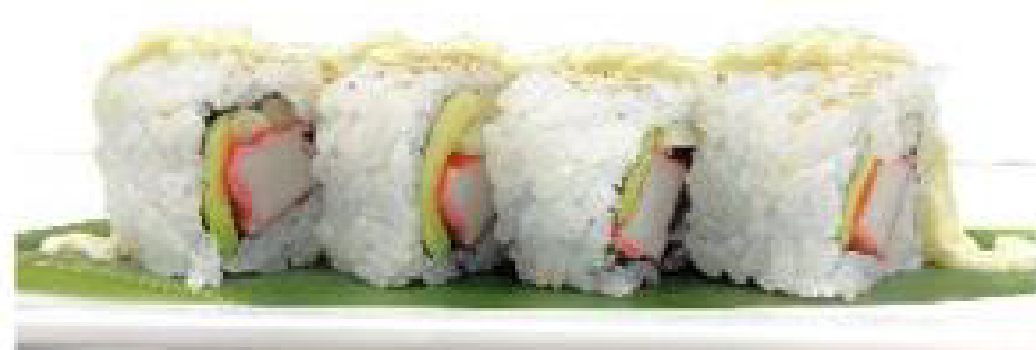
5/ CALIFORNIA ROLL surimi, avocado, cetriolo, sesamo, maionese