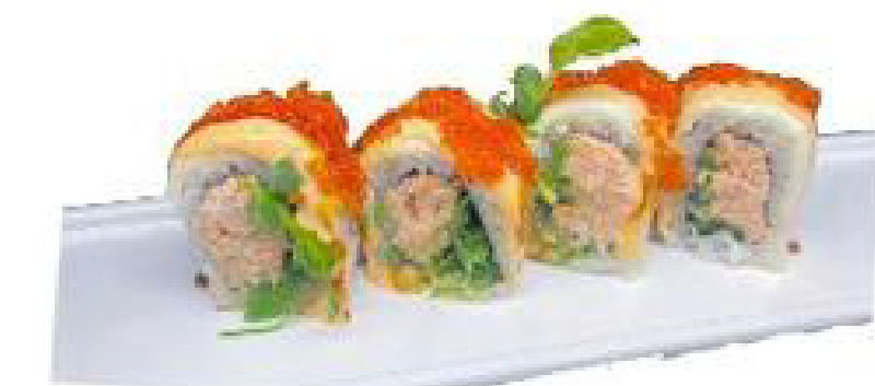
16/ CHEESE ROLL salmone cotto, wakame, tobiko rosso, cheese e salsa spicy