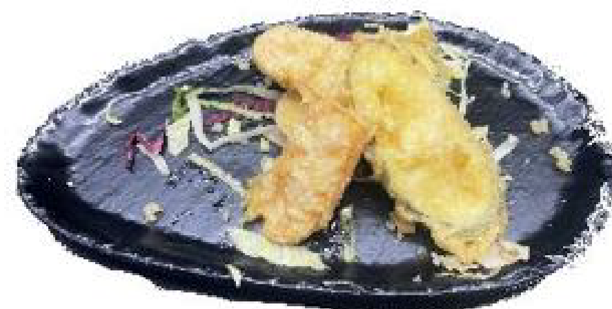
2/YASAI TEMPURA Verdure misti in tempura