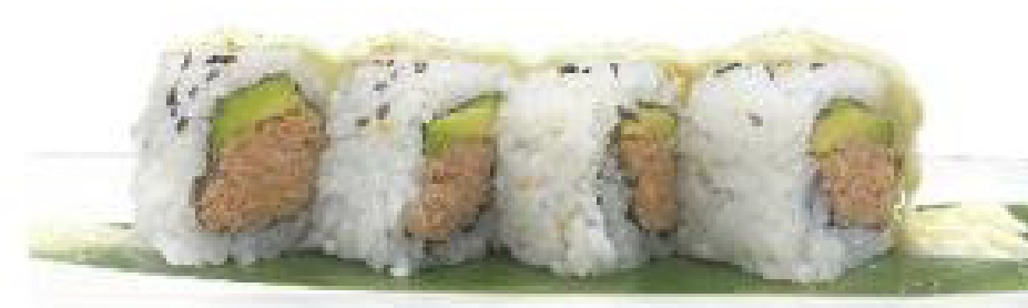
3/ RIO ROLL roll di riso farciti con alga nori, tonno cotto, pistacchio, maionese e salsa teriyaki