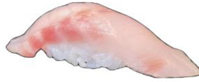
3/ NIGIRI SUZUKI branzino