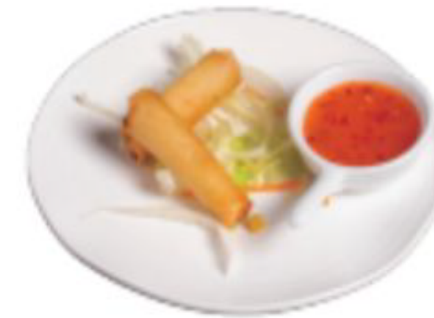
4/ SAMURAI STICK croccanti involtini ripieno di pesce misti