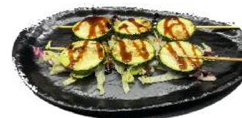
4/ZUCCHINE YAKI filetto di salmone