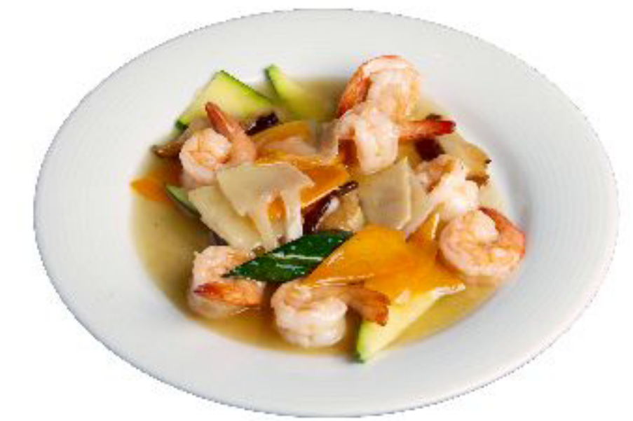
4/GAMBERI CON VERDURE gamberi saltato con verdure misti