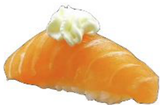
16/ NIGIRI PHILA salmone e philadelphia