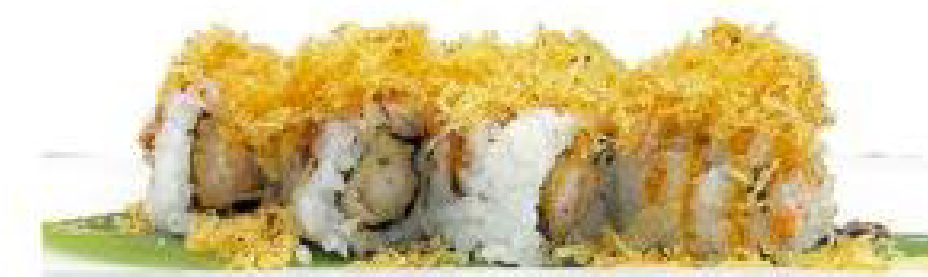
8/ EBI TEN gambero in tempura, patatine fritte, salsa teriyaki e maionese