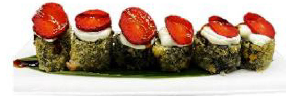
4/ICHIGO MAKI roll di riso fritto,salmone fragole,philadelphia, teriyaki