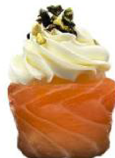
3/ GUNKAN FLOWER salmone con philadelphia