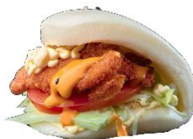
12/BAO TORY bao con pollo fritto,insalata,pomodori e maionese piccante