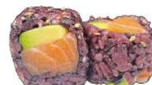
11/ BLACK SAKE riso venere, salmone crudo, avocado