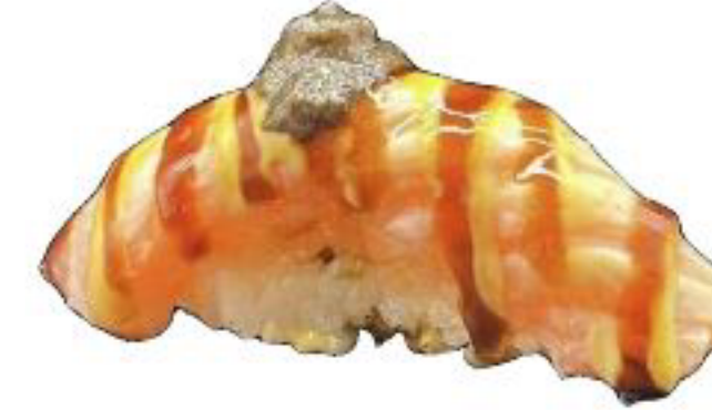
9/ NIGIRI TARTUFO SAKE salmone scottato con maionese piccante,teriyaki e tartufo