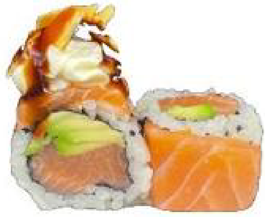
1/ ALMOND SAKE salmone, philadelphia, avocado, mandorle, teriyaki