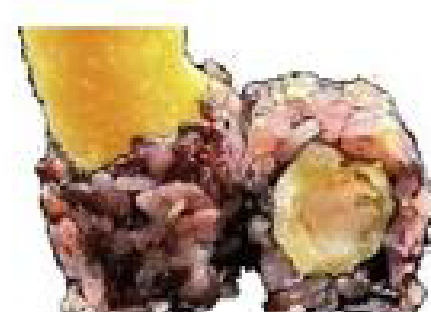
14/ BLACK EBITEN riso venere, gambero in tempura