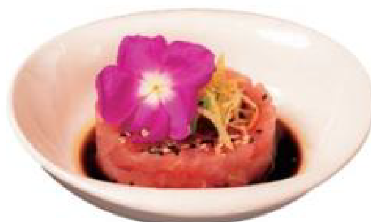
6/ TARTARE TUNA tonno tritato con lo salsa dello chef