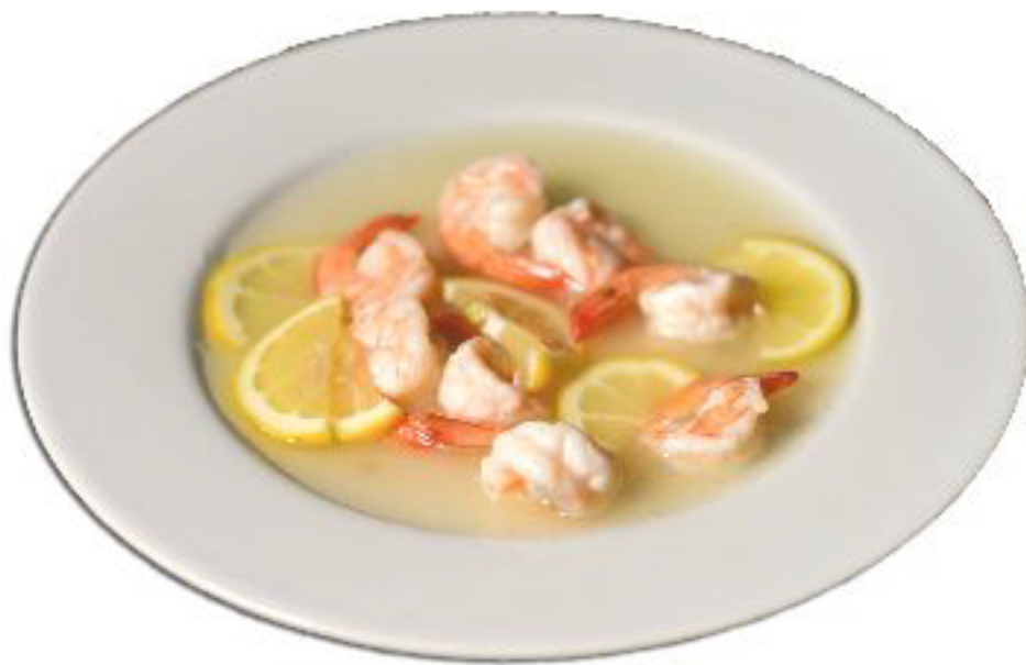
5/GAMBERI AL LIMONE gamberi saltato con salsa al limone