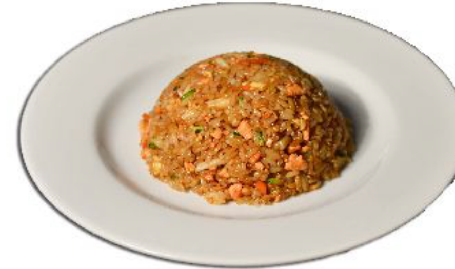
3/YAKI MESH riso con uova,verdure misti e pesce misti