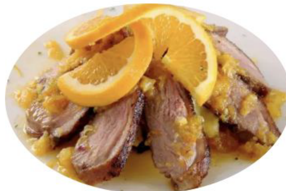
8/ANATRA ARANCIA anatra con salsa arancia