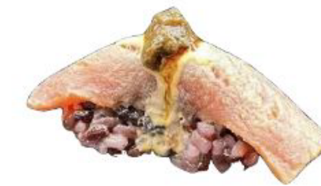
14/ NIGIRI BLACK TUNA TARTUFO riso venere con tonno scottato,tartufo,maio piccante e teriyaki