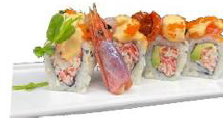
15/ ROSSO SICILIANO surimi, salmone, gambero rosso, tobiko rosso e maio piccante