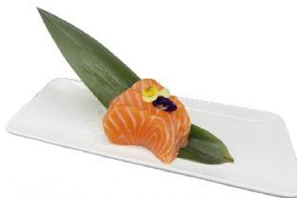
1/ SASHIMI SAKE salmone