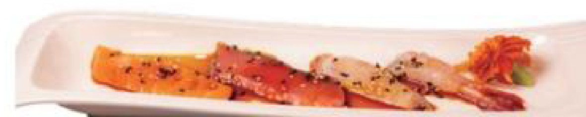
7/ CARPACCIO MISTO carpaccio di pesce con olio oliva e sale pepe