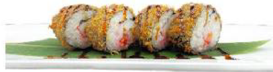
2/FUTO FRITTO roll di riso fritto,salmone,polpa di granchio,tobiko rosso,philadelphia,teriyaki