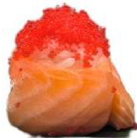
1/ GUNKAN TOBIKO bocconcini di riso avvolti con salmone crudo, guarniti con uova di pesce volante