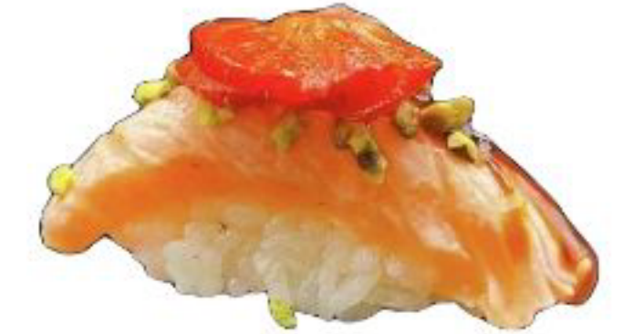
10/ NIGIRI FRAGOLA salmone scottato con fragola,pistacchio e teriyaki