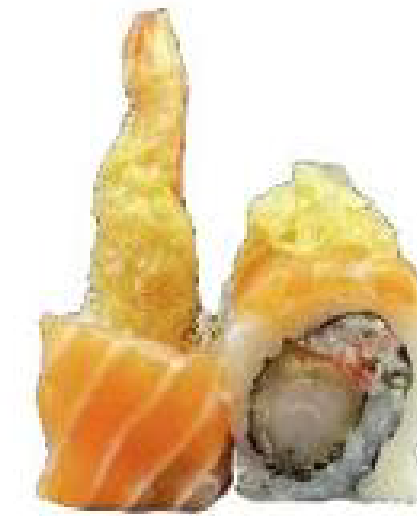
7/ TIGER ROLL gamberi tempura, polpa di granchio, tobiko, farina di tempura, maionese, teriyaki