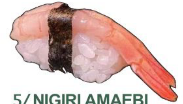
5/ NIGIRI AMAEBI gambero rosso