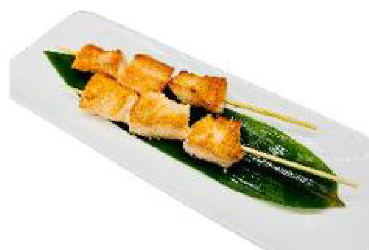
2/TORI YAKI spiedini di pollo