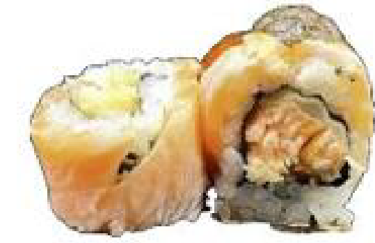
4/ NORI ROLL salmone, avocado, philadelphia, salsa tartufo