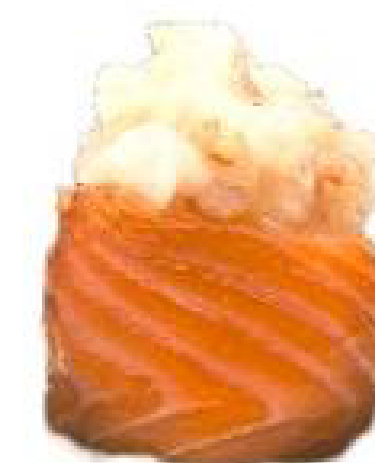
4/ GUNKAN AMAEBI salmone, riso, gambero rosso