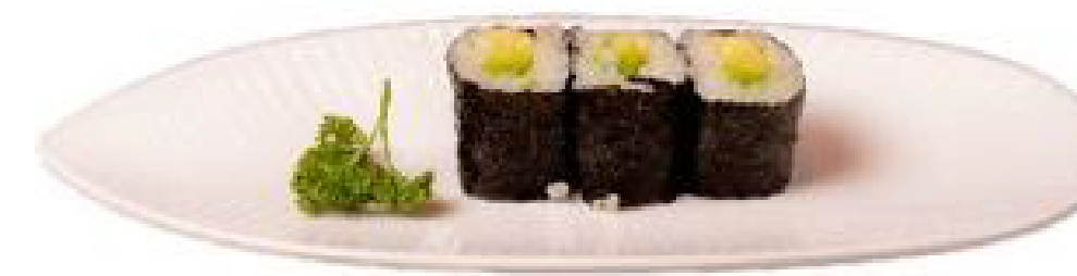
3/HOSO AVOCADO avocado