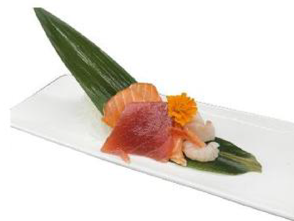
3/ SASHIMI MISTI pesce misto