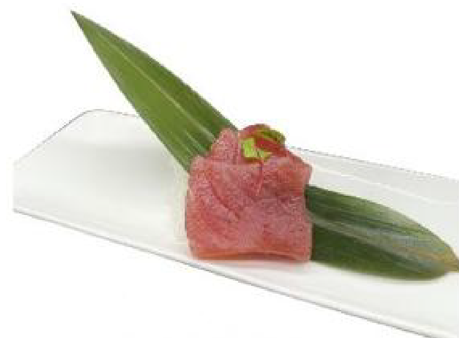
2/ SHIMI TUNA tonno