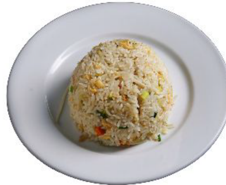
2/YASAI MESH riso con carote,zucchine e uova