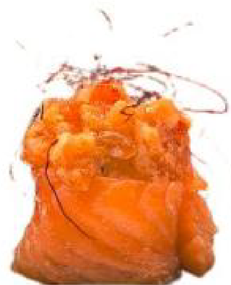
2/ GUNKAN SPICY SAKE salmone crudo, bocconcini di riso avvolti con alga nori e spicy mayo