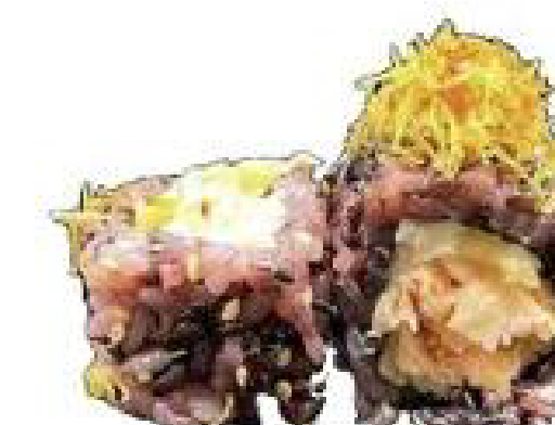
16/ BLACK SAKE TEMPURA riso venere, salmone in tempura, kataifi, teriyaki e maio