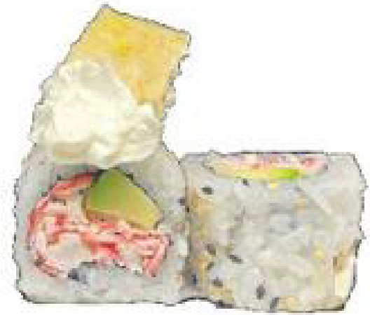
5/ CALIFORNIA FLOWER surimi, avocado, philadelphia, fiori di zucca fritti, teriyaki