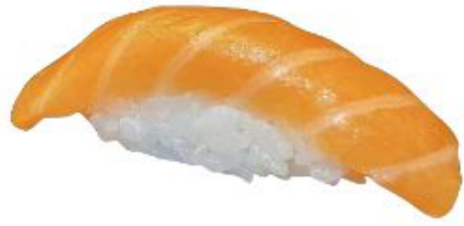
1/ NIGIRI SAKE salmone