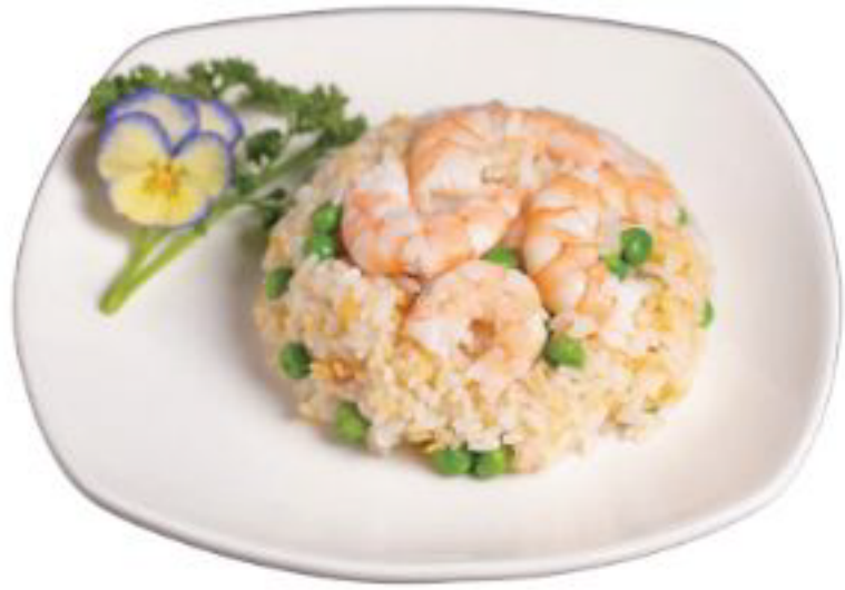
1/RISO YANGZHOU riso con verdure misti,mais,cipolla,funghi,piselli, gamberi,uovo