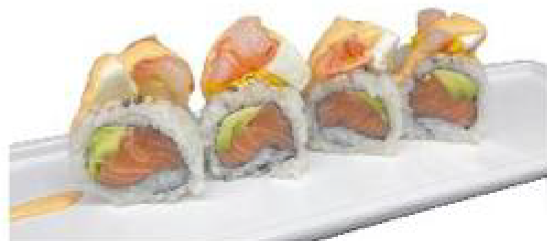
13/ ARGENTARIO ROLL salmone, avocado, mozzar ella e gambero rosso