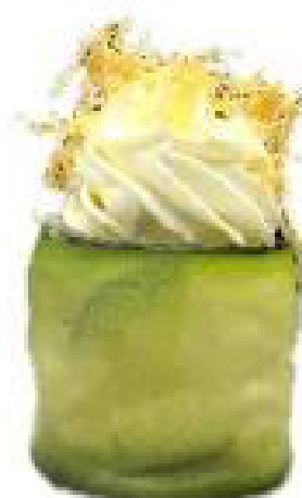
7/ GUNKAN ZUCCHINE bocconcini di riso avvolti con zucchine, guarniti con philadelphia, kataifi e teriyaki