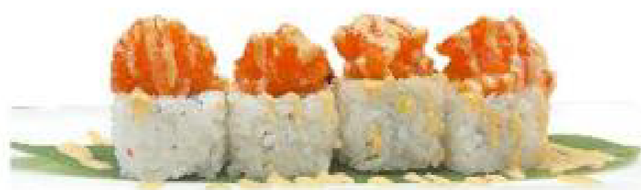
9/ YOSHI ROLL salmone, avocado, salsa a spicy