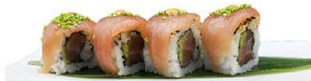
2/ MAGURO AVOCADO roll di riso con alga nori e tonno crudo, avocado, guarniti con sesamo