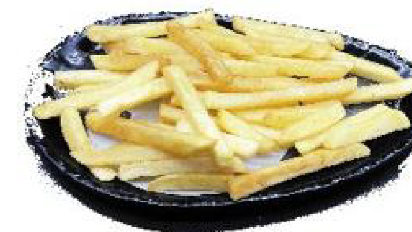
4/ PATATINE FRITTE