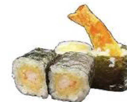
4/HOSO EBITEN ebi tempura