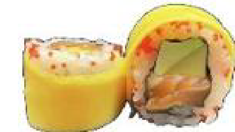
12/ MANGO ROLL salmone crudo, mango fresco, mandorle, salsa mango