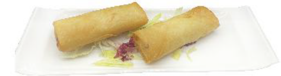
5/ INVOLTINI PRIMAVERA acroccanti involtini ripieno di crauti e carote