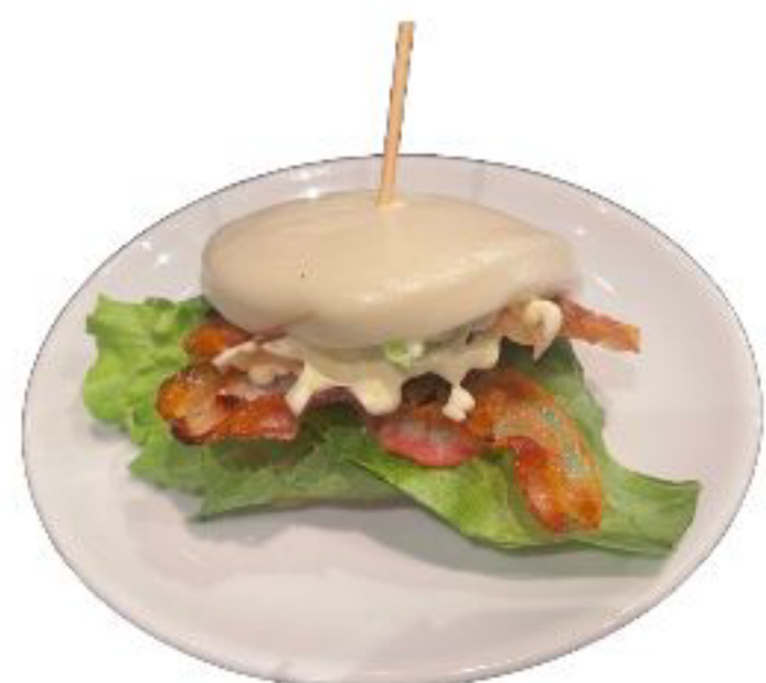
11/BAO BACON bao con bacon, cetrioli,insalata,pomodori e maionese