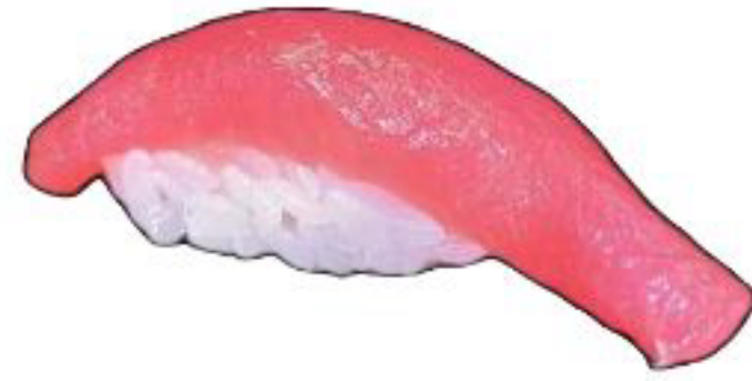
2/ NIGIRI MAGURO tonno