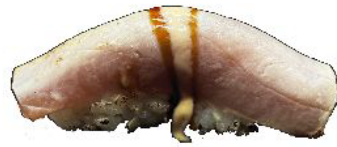
7/ NIGIRI FLAMBE TUNA tonno scottato con maionese piccante e teriyaki