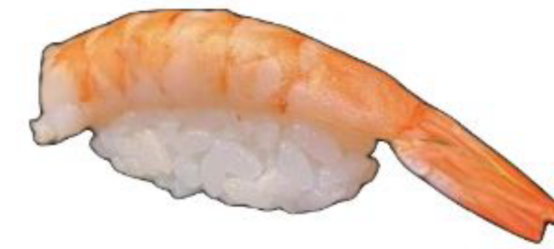
4/ NIGIRI EBI gambero cotto