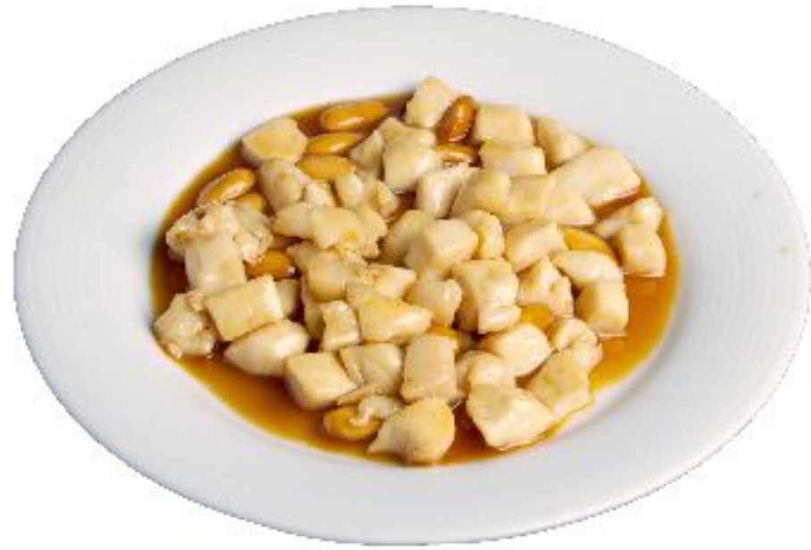
1/POLLO ALLE MANDORLE pollo saltato con mandorle