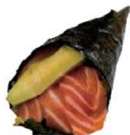
1/ TEMAKI SAKE salmone, avocado