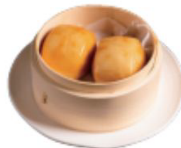
8/ PANE FRITTO PANE FRITTO