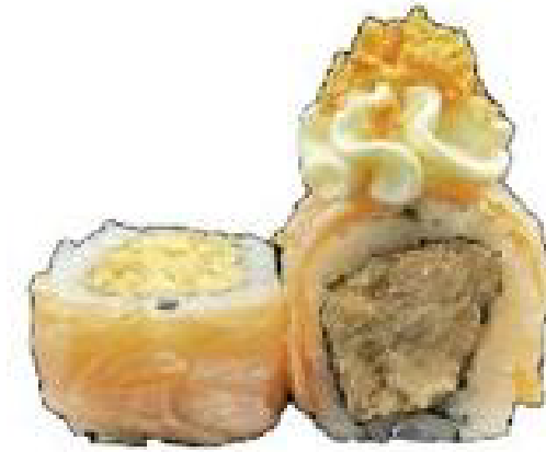
6/ MIURA SPECIALE roll farciti con salmone cotto, philadelphia, farciti con salmone scottato, cipolla fritta, teriyaki