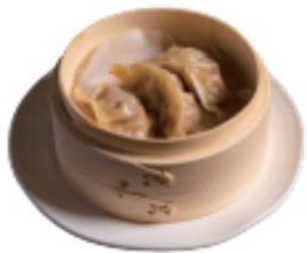
1 / RAVIOLI ravioli di carne al vapore