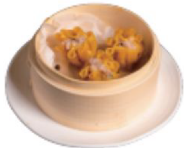
6/ SHAOMAI ravioli di gamberi e carne