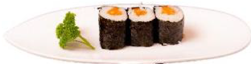
1/HOSO SAKE salmone