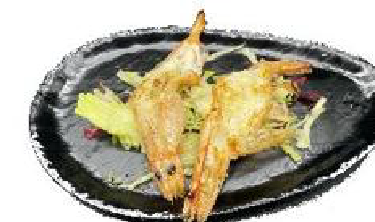
5/GAMBERONI ALLA GRIGLIA gamberoni