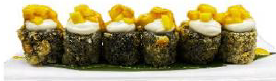
5/MANGO MAKI roll di riso fritto,salmone,mango, philadelphia,salsa mango