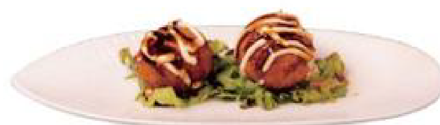
6/TAKO YAKI polpa di granchio fritta