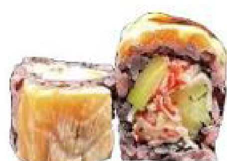
13/ BLACK CALIFORNIA riso venere, salmone scottato, avocado, cetriolo, surimi, avocado