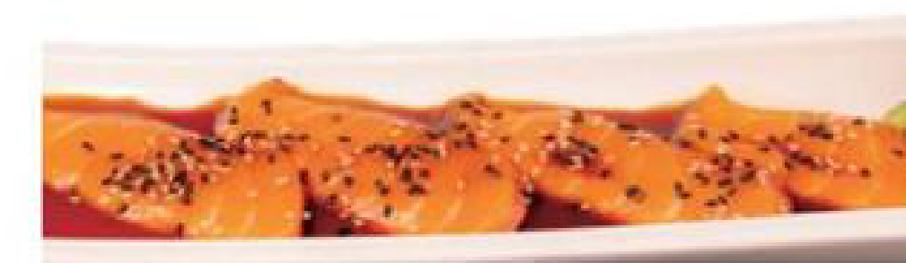
8/ CARPACCIO SAKE carpaccio di salmone con salsa ponzu