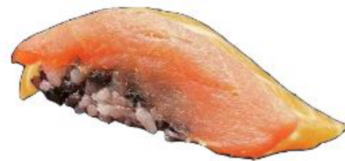
12/ NIGIRI BLACK TUNA riso venere con tonno