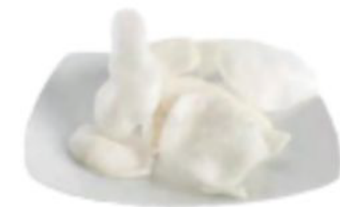
10/NUVOLETTE DI DRAGO fecola di patate