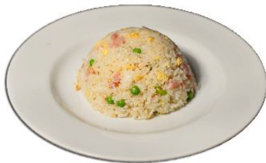
5/RISO CANTONESE riso con prosciutto cotto,uova e piselli