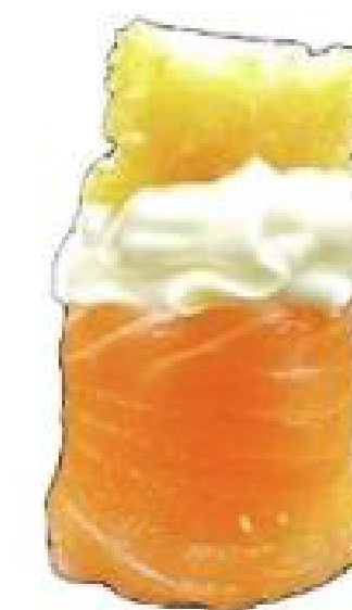
5/ GUNKAN EBI salmone scottato, guarito con philadelphia, gamberi in tempura e teriyaki