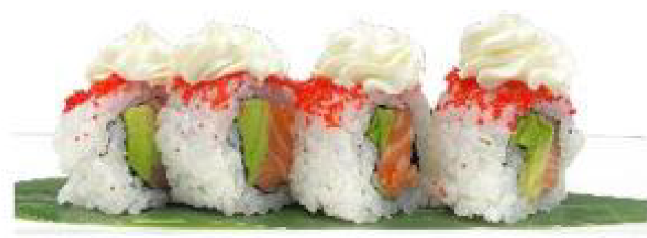
6/ SAKE FLOWER salmone, avocado, philadelphia, tobiko rosso, salsa teriyaki