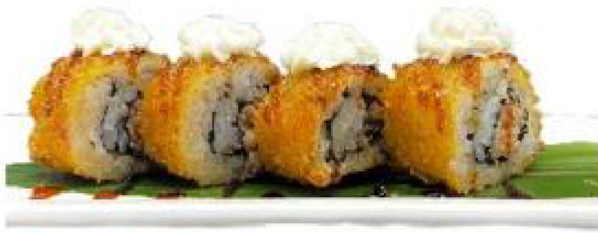
1/FUJI ROLL roll di riso fritto,salmone crudo,avocado,philadelphia, teriyaki