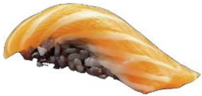
11/ NIGIRI BLACK SAKE riso venere con salmone