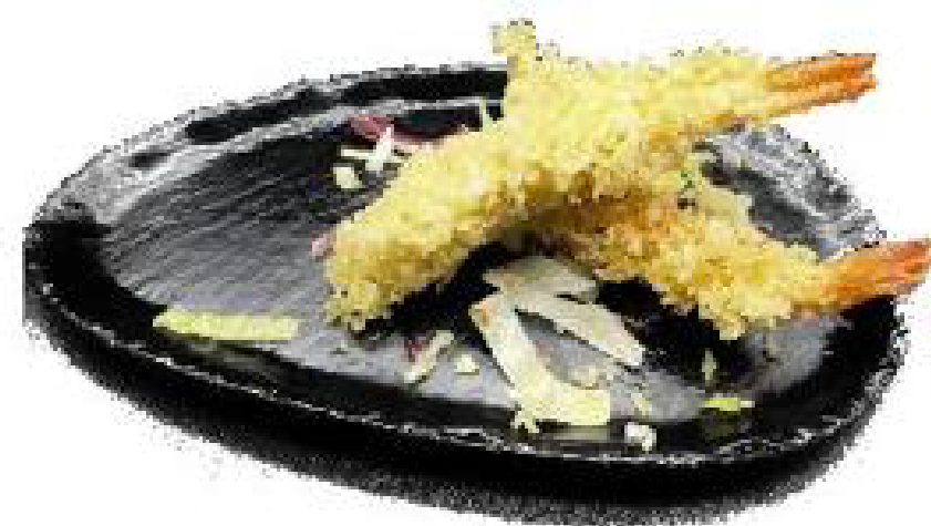
1/EBI TEMPURA gambero in tempura