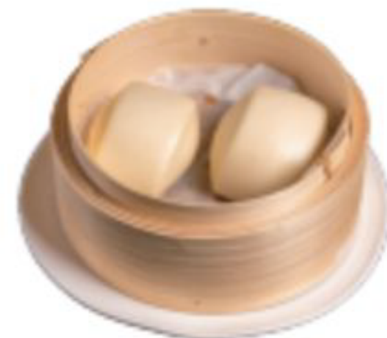
7 / PANE CINESE PANE DOLCE