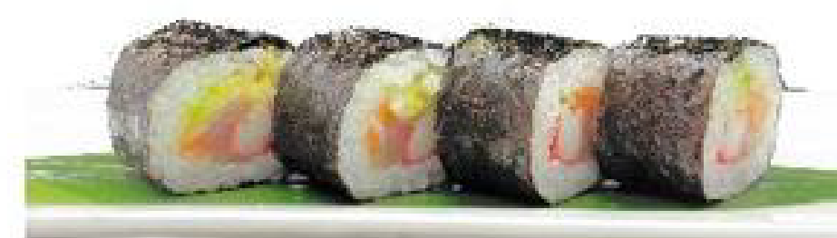
7/ FUTU MAKI salmone crudo, surimi, avocado, carote giallo, alghe salsa teriyaki