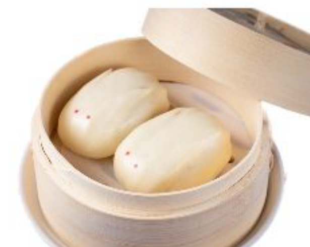
9/ BAO CREMA Pane cinese con crema gialla