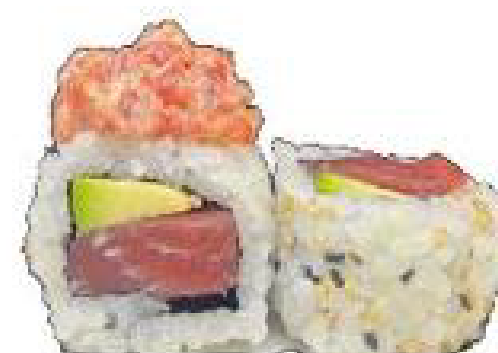
10/ TUNA SPICY tonno, avocado, salsa spicy