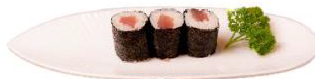
2/HOSO TUNA tonno