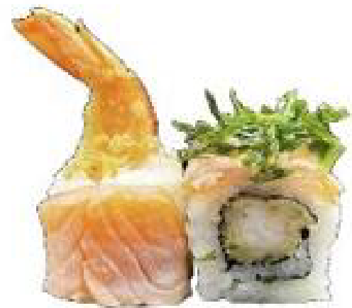
9/ RUCOLA ROLL gambero in tempura, rucola fritti, salsa teriyaki