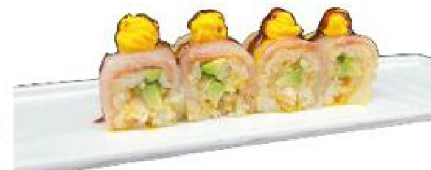
14/ YELLOW SUZUKI sfoglia di soia giallo, gambero in tempura, avocado, branzino e crema zafferano, teriyaki