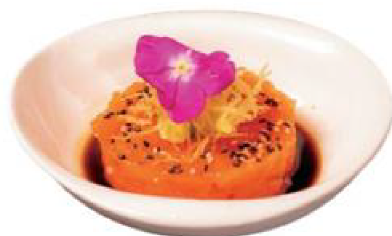
5/ TARTARE SAKE salmone tritato con lo salsa dello chef