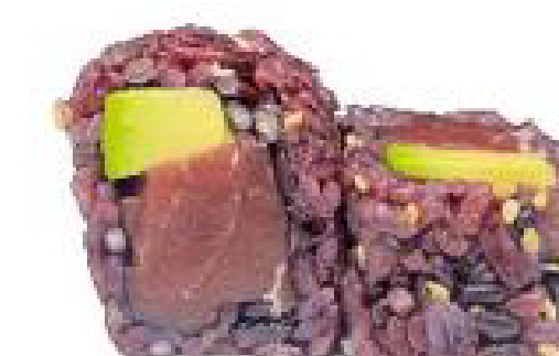
12/ BLACK TUNA riso venere, tonno, avocado