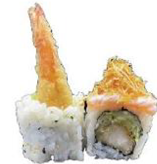
8/ DRAGON ROLL gamberi tempura, iceberg, salmone scottato e teriyaki