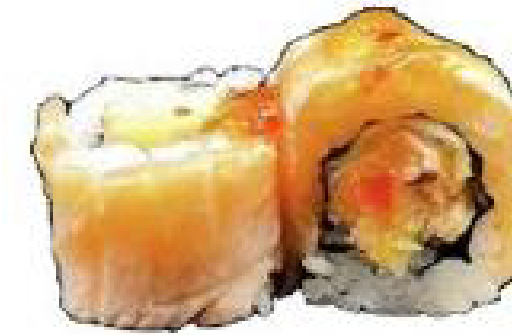
3/ MIEKO ROLL salmone fritto interno, salmone scottato esterno con salsa thai