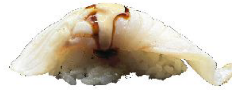
8/ NIGIRI FLAMBE SUZUKI branzino scottato con maionese piccante e teriyaki