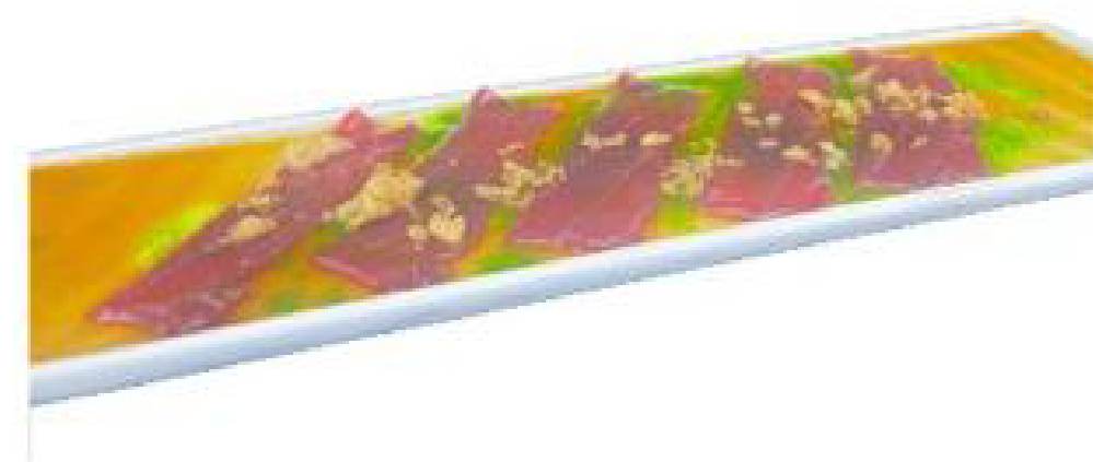
10/ GREEN TUNA tonno crudo, salsa ponzu, olio prezzemolo e cipolla frita