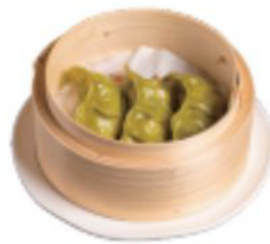
3 / RAVIOLI VERDURE ravioli di verdure