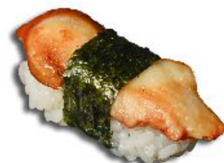
17/ NIGIRI UNAGI anguilla