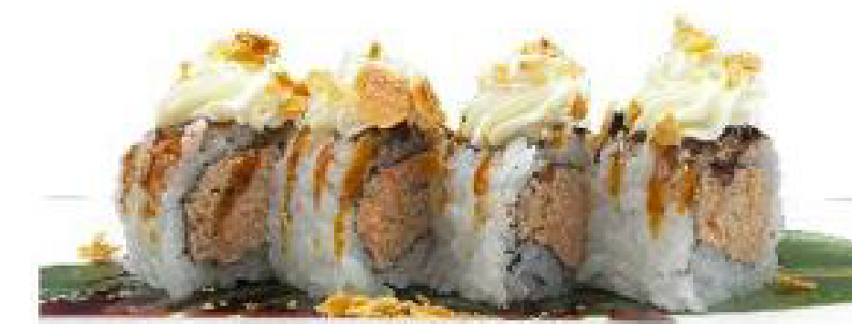
4/ MIURA ROLL salmone cotto, philadelphia, sesamo, salsa teriyaki