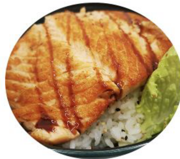
6/RISO SAKE riso con salmone alla griglia e salsa teriyaki