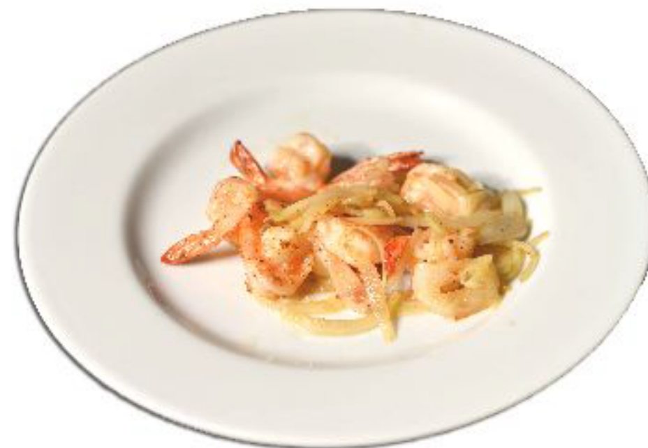
6/GAMBERI SALE PEPE gamberi saltati con sale, pepe, e cipolla