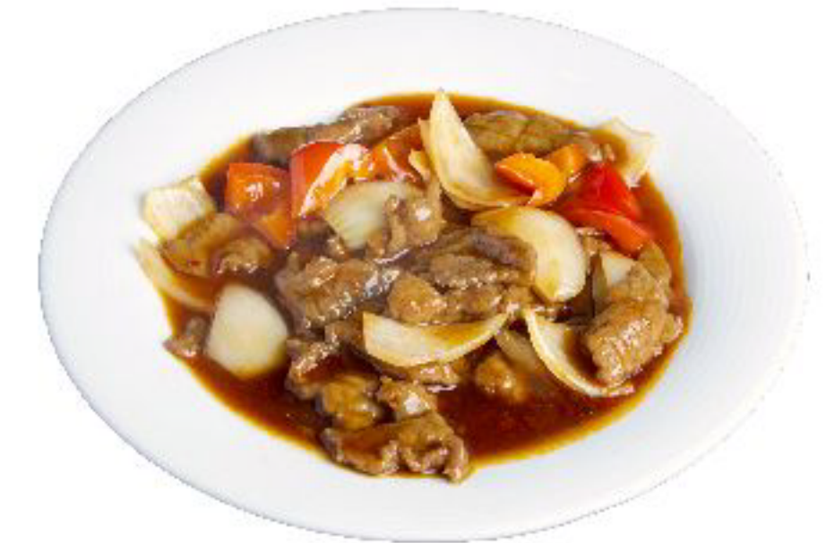
8/MANZO PICCANTE manzo saltato con verdure miste e piccante