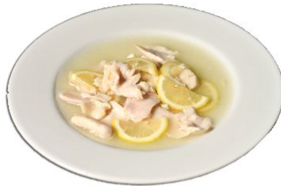
2/POLLO AL LIMONE pollo saltato al limone