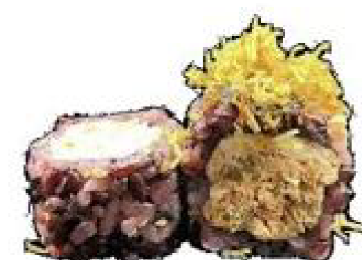
15/ BLACK MIURA riso venere, salmone cotto, kataifi