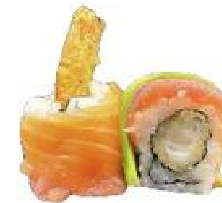
11/ RAINBOW ROLL avocado, cetrioli, polpa di granchio, maionese e pesce misto