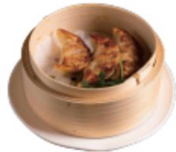
2 / RAVIOLI PIASTRA ravioli di carne alla piastra