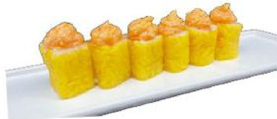
6/HOSO YELLOW sfoglia soia giallo,salmone piccante