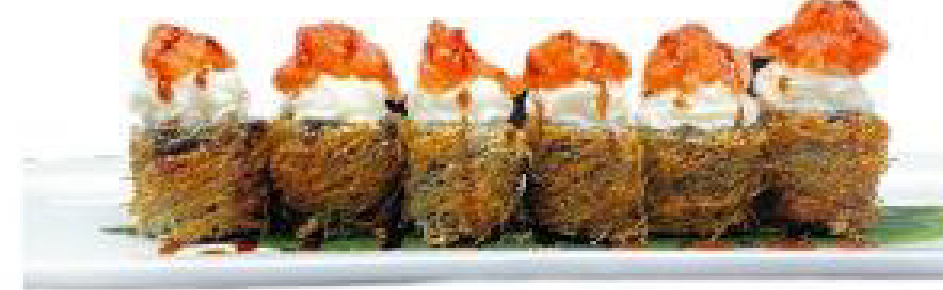
3/HOT ROLL roll di riso fritto,salmone,kataifi e salsa spicy