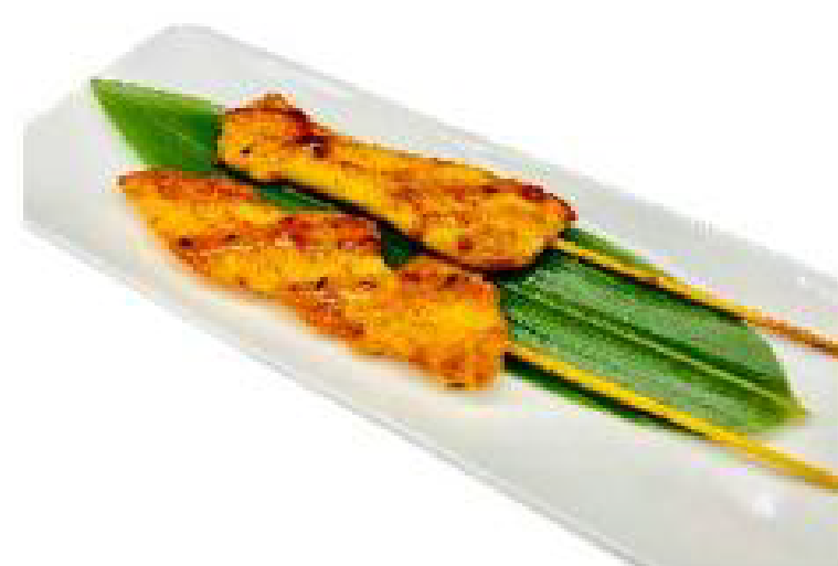
3/SAKE YAKI filetto di salmone