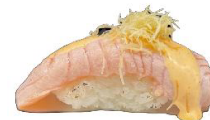
19/ NIGIRI SPICY SAKE kataifi,salmone scottato e maio piccante