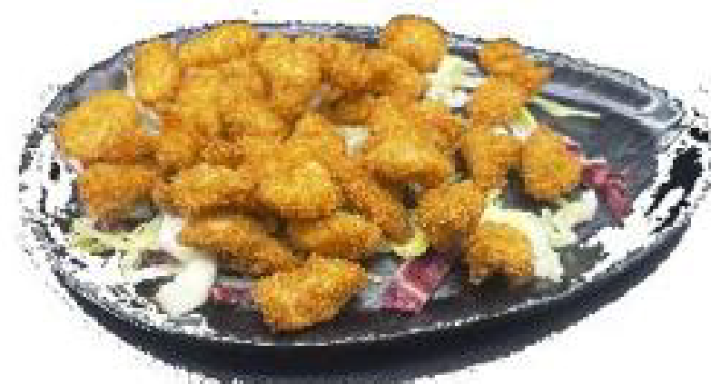
5/YAKI TORI pollo fritto