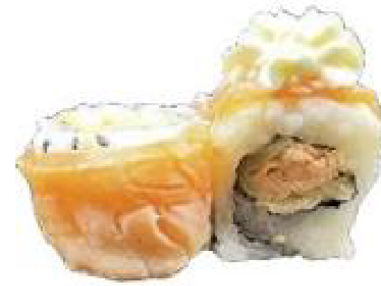
2/ TAKISA ROLL salmone fritto, philadelphia guariti con salmone scottato, teriyaki e kataifi