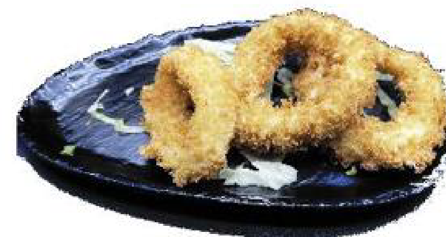
3/CALAMARI FRITTI Anelli di totano fritti