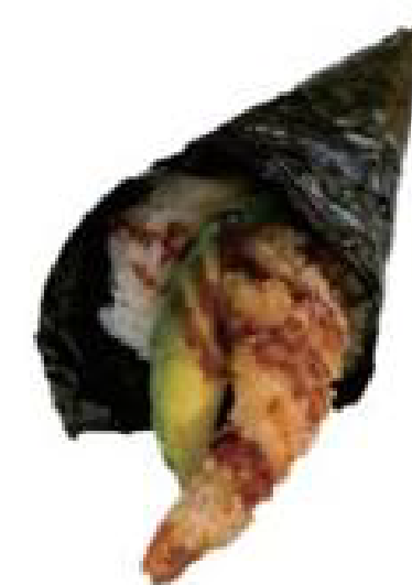
3/ TEMAKI TEMPURA gamberi fritti con maionese e teriyaki