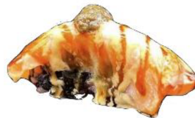
13/ NIGIRI BLACK SAKE TARTUFO riso venere con salmone scottato,tartufo,maio piccante e teriyaki