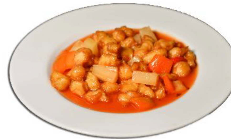
3/POLLO AGRODOLCE pollo saltato con ananas, pomodorini e salsa agrodolce