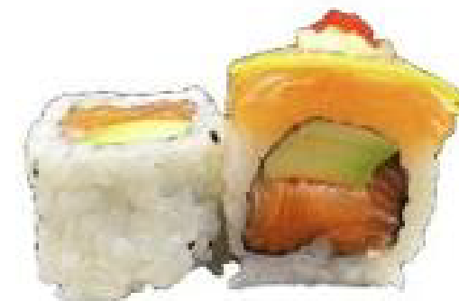
10/ LEMON ROLL salmone, avocado, lime, tobiko, maionese e teriyaki