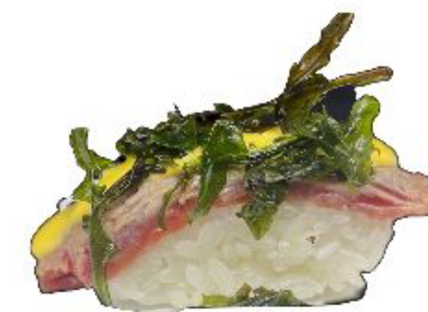
18/ NIGIRI BEEF PLUS manzo scottato guarnito con rucola fritta con salsa mango